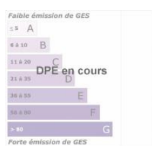
DPE ANCIENNE VERSION

CAP IMMOBILIER , SIRET : 4 90 7 8 9 9 4 , RCS : , SARL au capital de 3000 € | Garant : QBE Carte professionnelle N° CPI21012017000017314 délivrée par CCI cote d'or le 03/06/2020, Montant garanti de 110000 €.